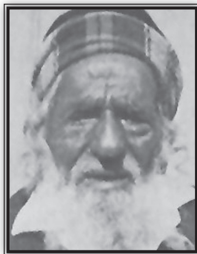
הרב משה דנין