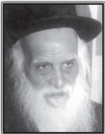
הרב שוכר חבשוש

נולד בצנעא בשנת תרע"א (1911) בערך. נפטר בבני ברק בכ"ח אייר תשנ"ט (1999). קיבל תורה מרבינו יחיא יצחק הלוי, והיה מאחרוני צעירי תלמידיו. לאחר פטירת רבינו למד לפני הרב יוסף שמן ולפני הרב סעיד אלעוזירי.