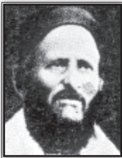
הרב חיים דמתי