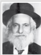
הג"ר עואץ' מתנא זצ"ל