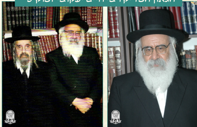
בתרומתו הנדיבה הודפסו הספרים "עריכת שולחן ילקוט - חיים" יג' חלקים. יום פטירתו כד' כסלו התשע"ד ומקום מנוחתו במרומי הר הזיתים.