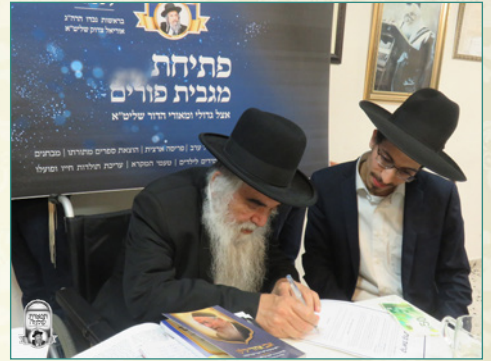
מרנן ורבנן נרתמים לעזרת ארגון "תפארת שלמה"