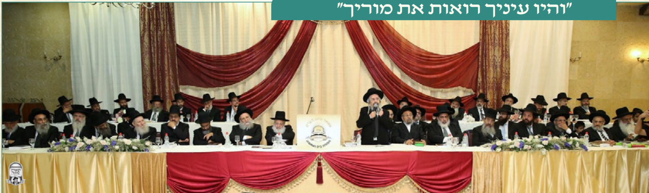
בשמחת בית השואבה שע"י חניכי הישיבות