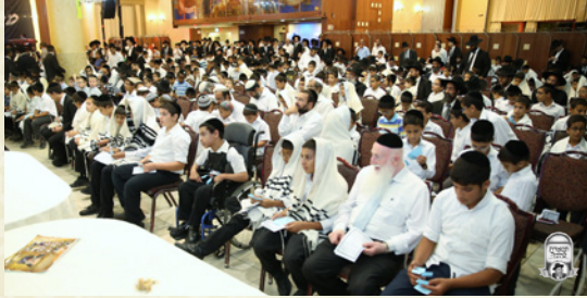
אמירת תהילים ע"י ילדי "אלפי יהודה"