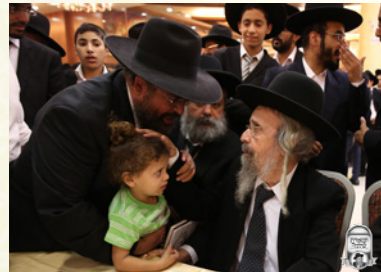
בשמחת בית השואבה שע"י "חניכי הישיבות"